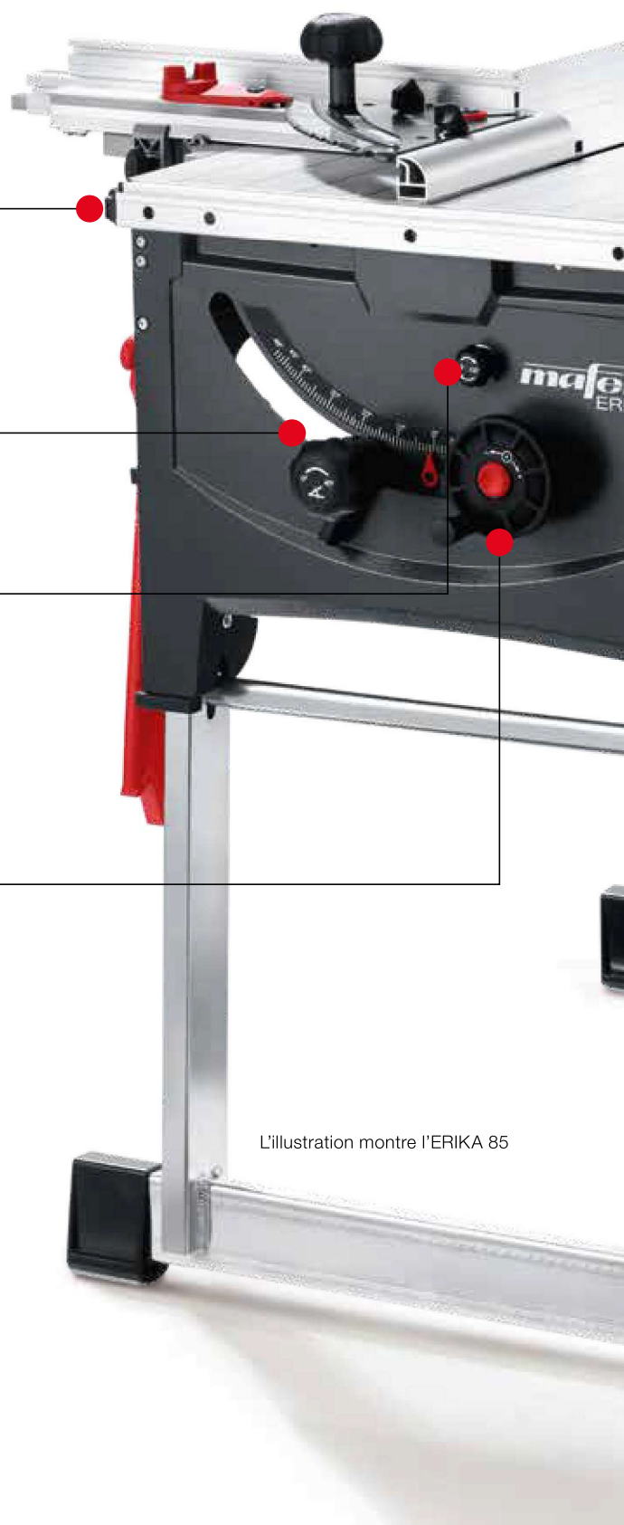
L'illustration montre l'ERIKA 85