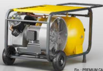
Fig. : PREMIUM CAR 660/70 D