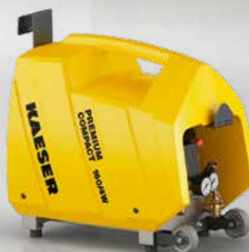
Fig. : PREMIUM COMPACT 160/4W