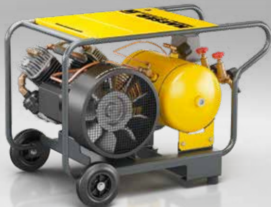
Fig. : PREMIUM CAR 150-2/16 W