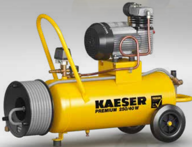
Fig. : PREMIUM 250/40 W