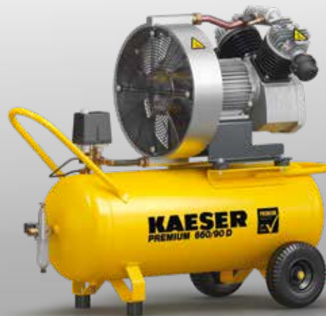
Fig. : PREMIUM 660/90 D