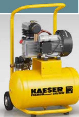
Fig. : PREMIUM COMPACT 250/30W