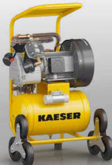
Fig. : PREMIUM COMPACT 450/30W