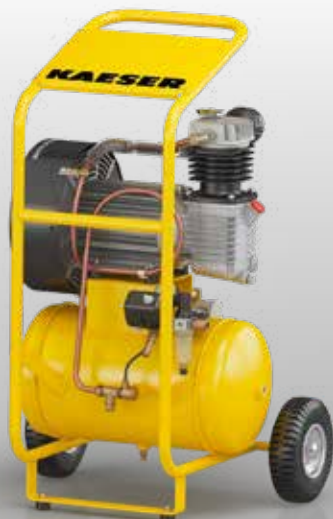
Fig. : PREMIUM COMPACT 350/30W