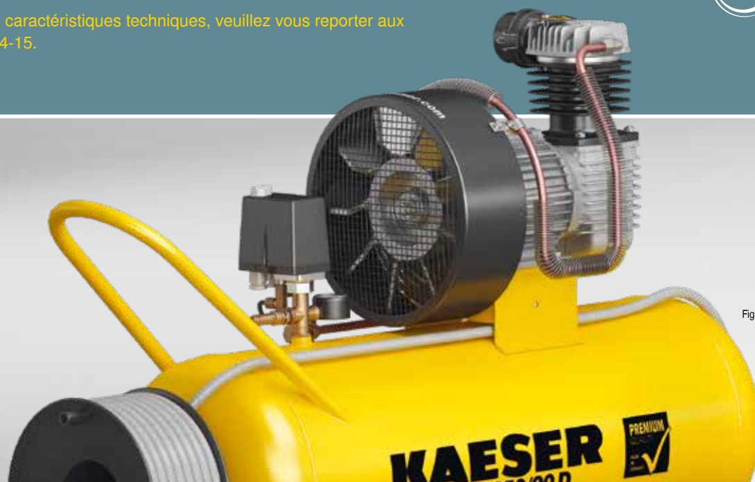
Fig. : PREMIUM 350/90 D