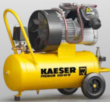
Fig. : PREMIUM 450/40 W