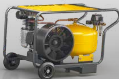
Fig. : PREMIUM CAR 350/30 W