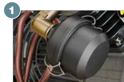
1 Filtre à air d'aspiration avec silencieux