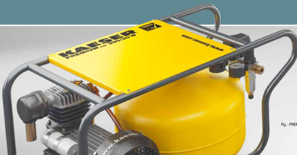
Fig. : PREMIUM CAR 330/30 W