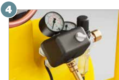
4 Pressostat avec démarrage à vide