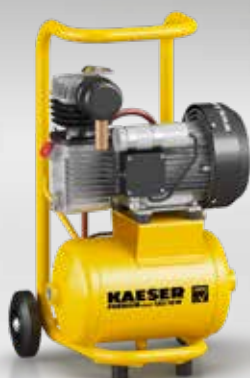
Fig. : PREMIUM SILENT 130/10W