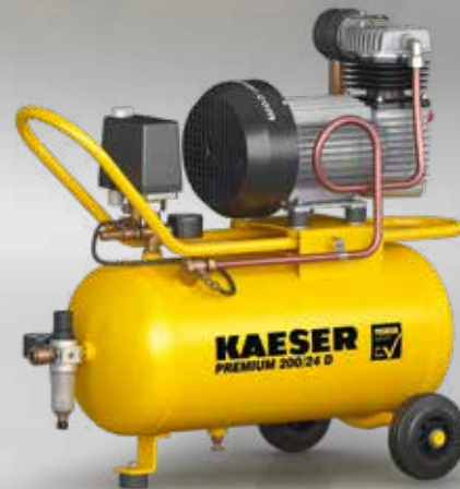
Fig. : PREMIUM 200/24 D