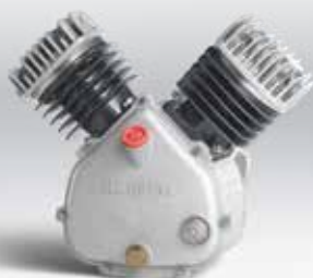
Bloc compresseur bi-cylindre