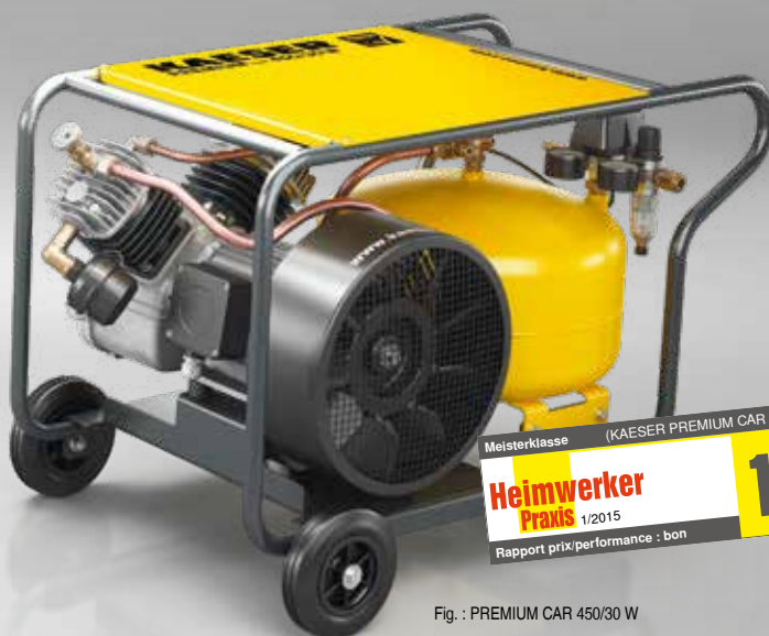
Fig. : PREMIUM CAR 450/30 W